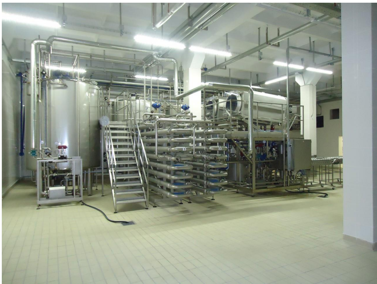
Oprema podjetja Protamol v mlekarni v Belgorodu.

Območje se že stoletja nahaja na trgovski poti med osrednjo Rusijo in severnim mestom Arhangelsk ob Belem morju, ki je bil nekoč celo glavno pristanišče v državi. Skozi pokrajino potekajo zvezne ceste in železnice ter rečna povezava med Volgo in Baltskim morjem. V prihodnosti bi se pomen regije lahko še povečal, če bi se uresničil projekt Nove Svilne poti, ki predvideva učinkovite prometne povezave med Evropo in Kitajsko preko Rusije.