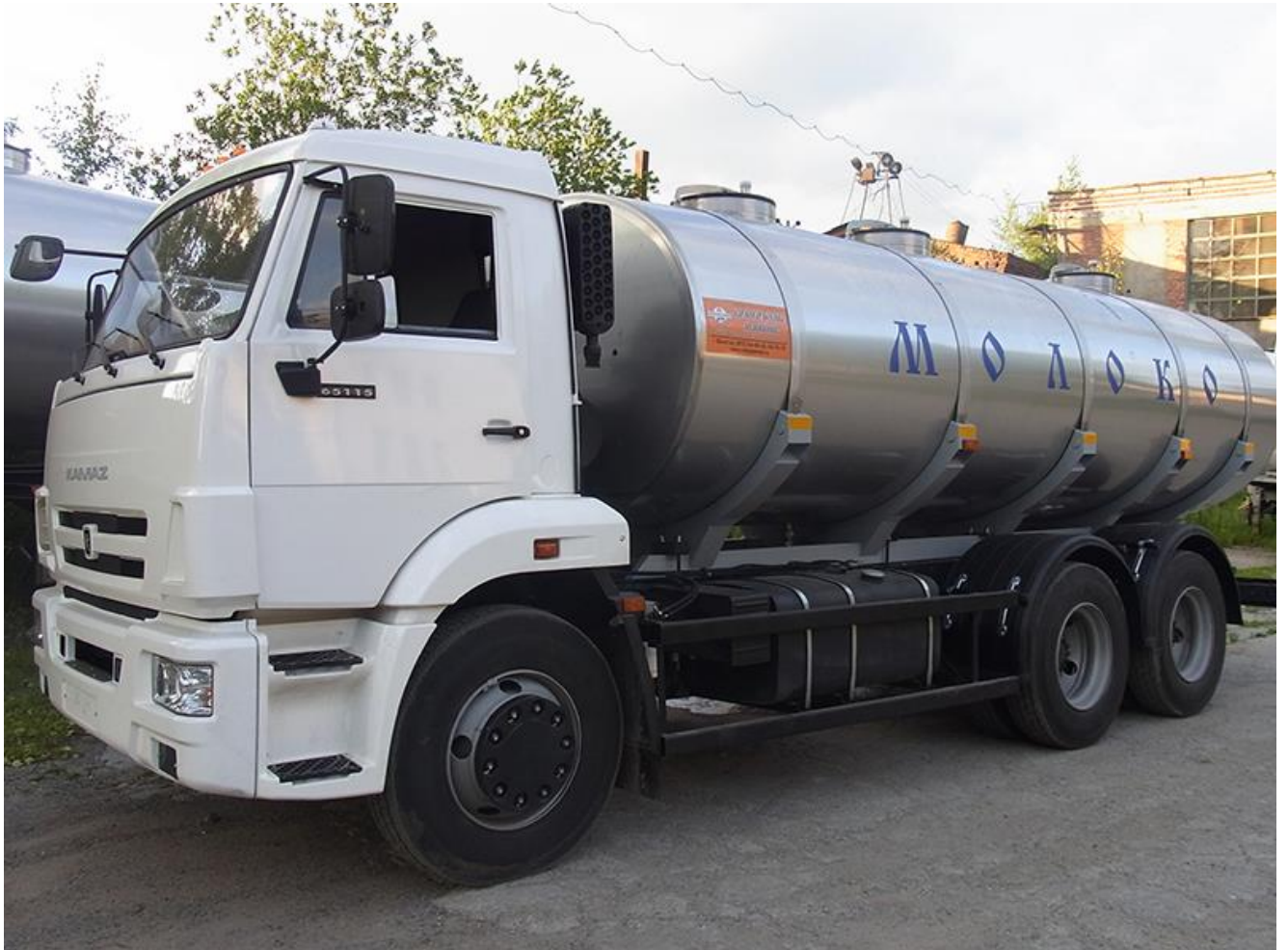
14000-litrska cisterna za mleko iz tovarne Vologodske mashiny (Vologda Machines) na ruskem tovornjaku KamAZ.